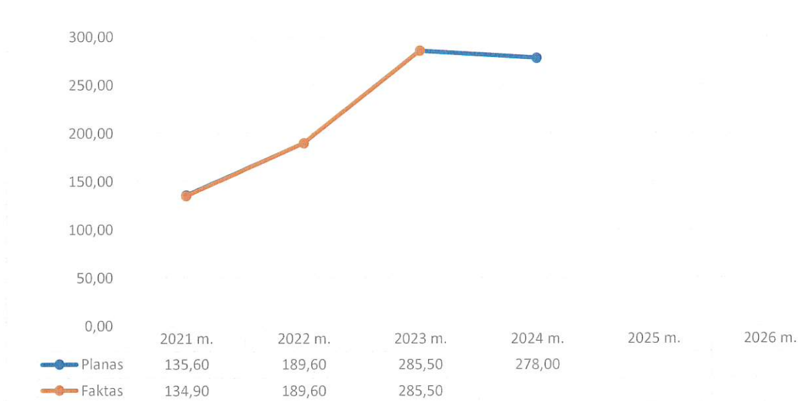
3 grafikas. Asignavimų panaudojimas (tūkst. Eur)