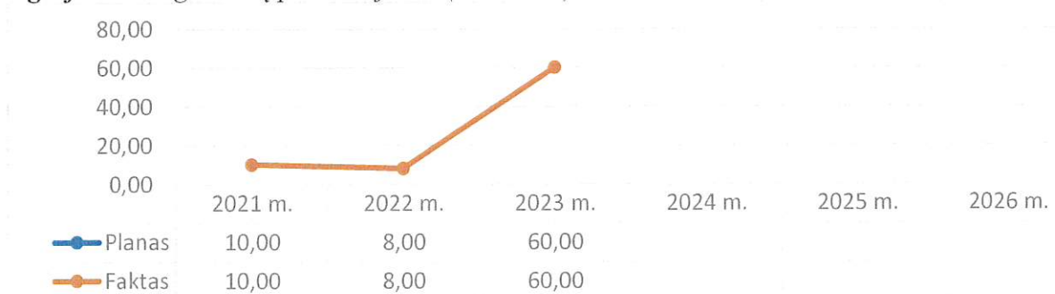
2 grafikas. Asignavimų panaudojimas (tūkst. Eur)

Asignavimų planas nebenumatomas, nes Palangos miesto savivaldybės tarybos 2023 m. spalio 5 d. sprendimu Nr. T2-246 įsteigtas VŠĮ „Jaunimo užimtumo ir savanorystės centras“ ir visas įstaigai pavestas funkcijas atlieka savarankiškai.